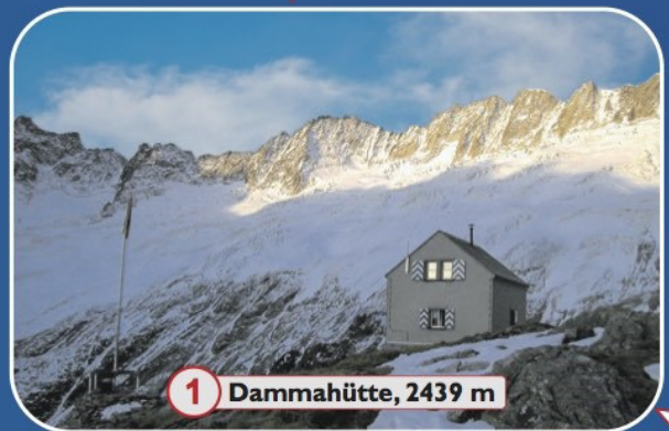
1 Dammahütte, 2439 m