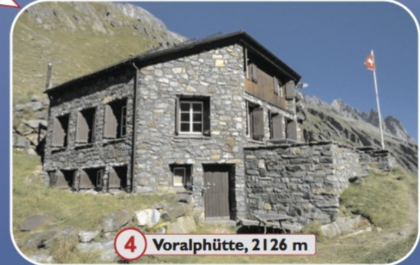
4 Voralphütte, 2126 m