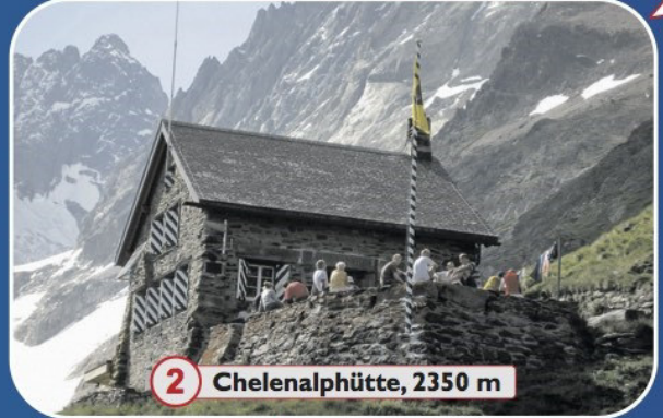
2 Chelentalphütte, 2350 m