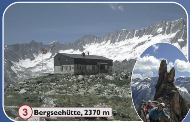
3 Bergseehütte, 2370 m