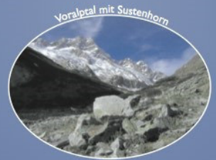
Voralp mit Sustenhorn