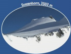
Sustenhorn, 3503 m