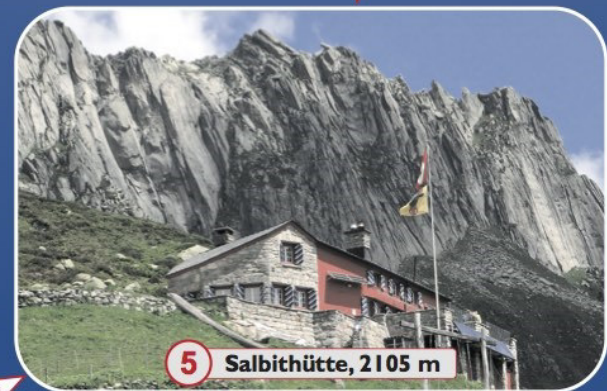
5 Salbithütte, 2105 m